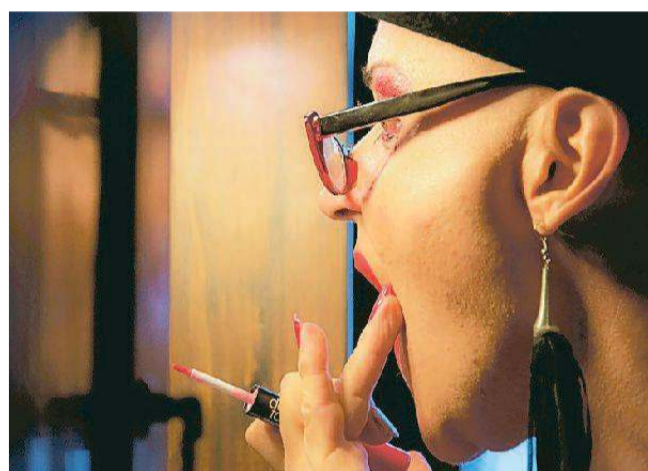
Uno degli scatti in mostra da domani in via Ripagrande

È in programma oggi alle 18.30 (iniziativa collaterale di Internazionale) l'inaugurazione al Museo del Risorgimento e della Resistenza di Ferrara (corso Ercole I d'Este, 19) della mostra "Io non ritratto. Peppino Impastato, una storia collettiva. Compagne, compagni, amici e familiari di Peppino ritratti oggi dai fotografi dell'associazione Asadin".