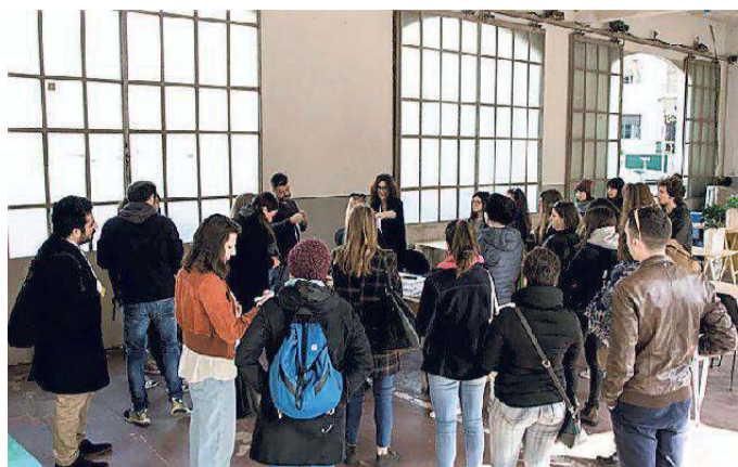
Un momento dell'inaugurazione di Riaperture a Factory Grisù